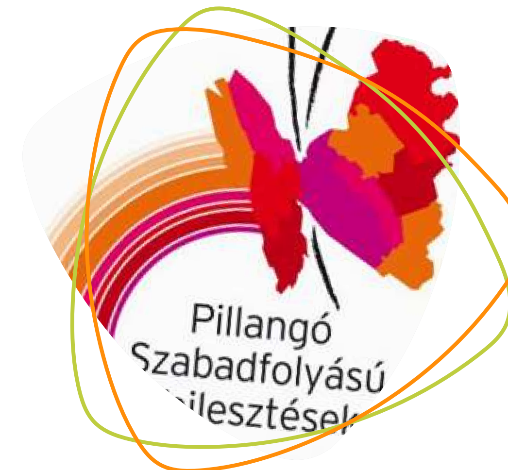
PRO CSEREHÁT EGYESÜLET